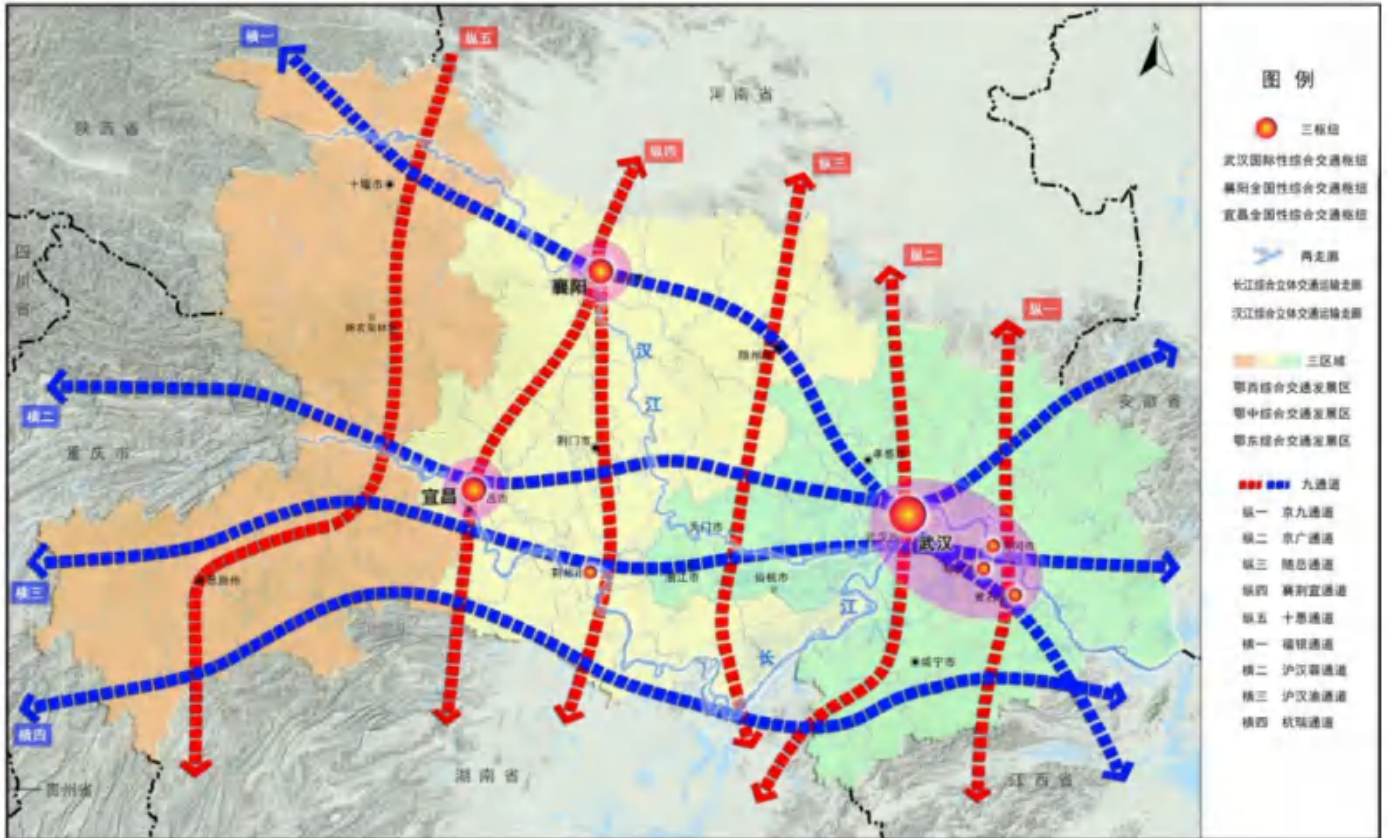
图 2 湖北省综合交通运输空间布局示意图